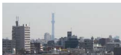
東京スカイツリーが見えます