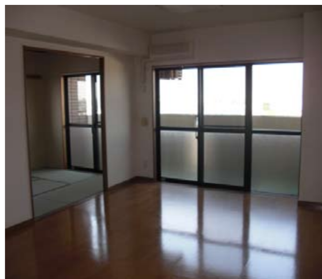
広々明るいリビング