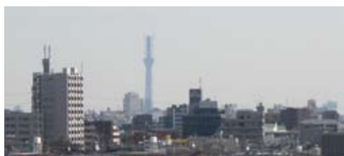
東京スカイツリーが見えます