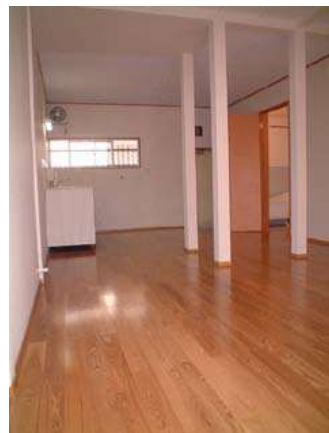
広々天然フローリング