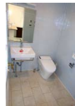
水色のガラス質タイル