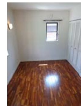
2階洋室は無垢のフローリングに扉